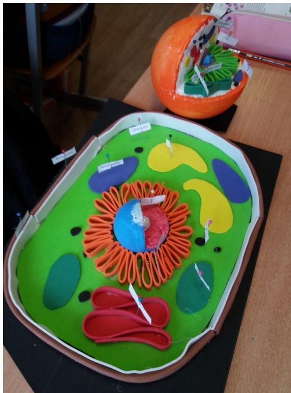
8. klases skolēni apgūst tēmu „Dzīvnieku uzbūves pamatprincipi”, pētot atšķirības augu un dzīvnieku šūnu uzbūvē, izmantojot šūnu modeļus.