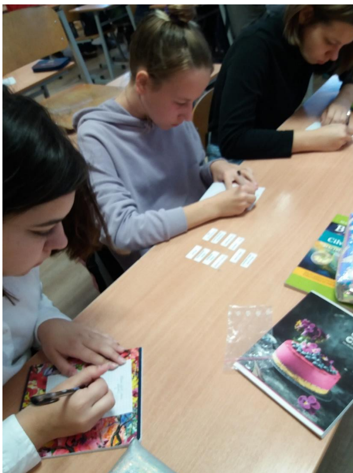
9.klases skolēni nostiprina zināšanas par cilvēka dzimumorgānu sistēmu, izspēlējot spēli „Olšūnas liktenis”.