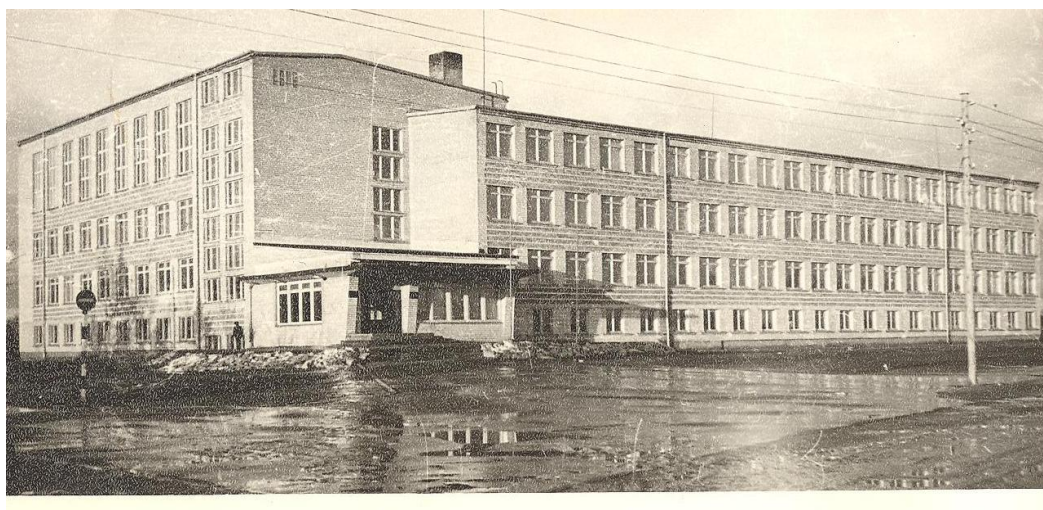
Jelgavas 4. vidusskola Akmeņu ielā 1 1964.

1964. gada 1. septembrī tiek atklāta jaunā ēka Akmeņu ielā 1. Skola iegūst Jelgavas 4. vidusskolas nosaukumu, un mācības tiek organizētas gan krievu, gan latviešu plūsmā.