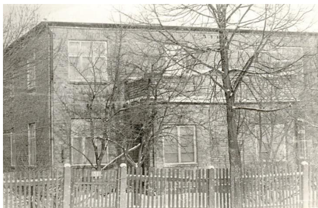
Brīvības bulvāris 31.

Jelgavas 4. vidusskola 1945. gada 11. janvārī sākotnēji tiek dibināta kā Jelgavas 2.septiņgadīgā skola, kas tolaik atrodas trijās ēkās - Brīvības bulvārī 31, Lāčplēša ielā 11 un Austrumu ielā 7.