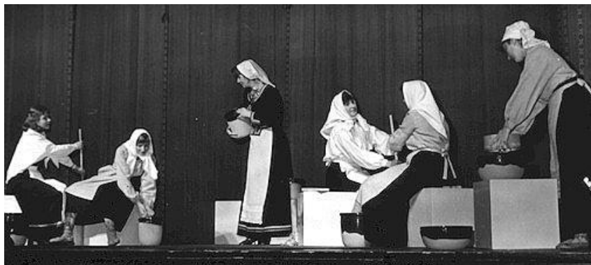
Izrāde „Pūt, vējiņi!”

1986. gadā skolas dramatiskais kolektīvs kļūst par skolēnu Tautas teātri. 6. un 7. Latvijas skolu jaunatnes dziesmu un deju svētkos piedalās un kļūst par laureātiem 4.-5.klašu koris, 9.-11.klašu jauktais koris, pūtēju orķestris. 6.- 7.klašu audzēkņi Latvijas televīzijas Jaunatnes, bērnu un mācību redakcijā ieraksta V.Plūdoņa un A. Celma iestudējumu "Eža kažociņš".