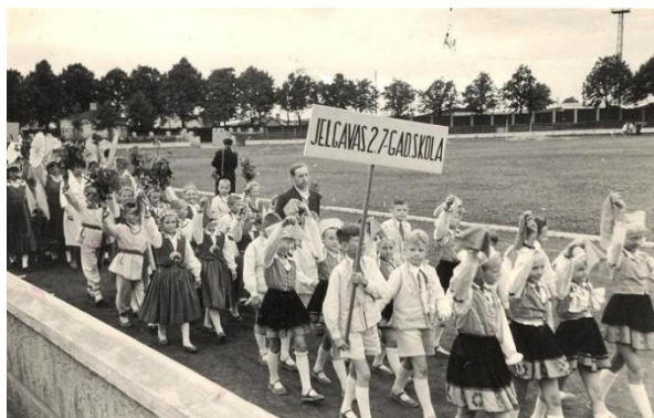
Skolēnu dziesmu un deju svētkos 1960.