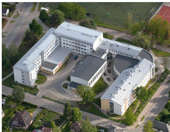
Jelgavas 4.vidusskola 2015. gads

2009./2010. mācību gada 1. septembrī tiek atklāta jaunā piebūve, kurā mācības uzsāk sākumskolas klases, izvietota moderna koncertzāle, informātikas kabineti, skaņu ierakstu studija.