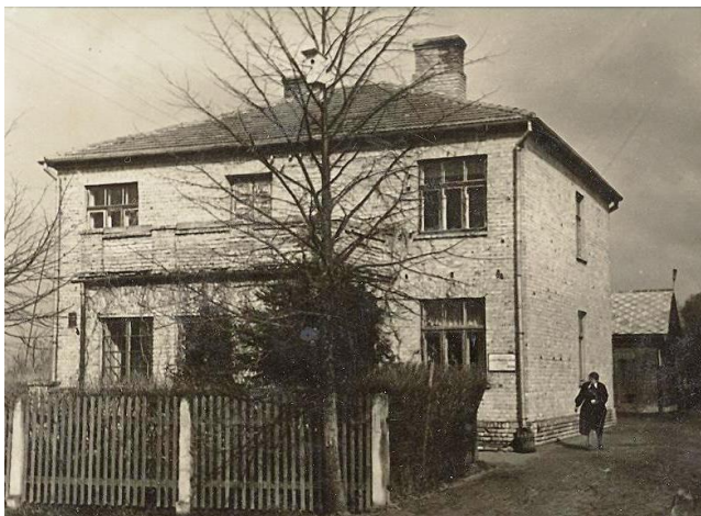
Austrumu iela 7.