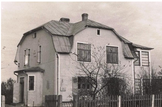
Lāčplēša iela 11.