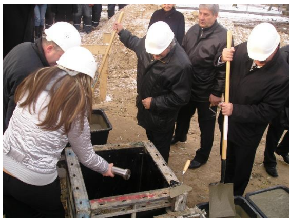
Vēstījums nākotnei jaunās skolas piebūves pamatos.

2009. gada 1. septembrī ar modernas virtuves izbūvi noslēdzas Jelgavas 4. vidusskolas piebūves celtniecības pirmā kārtā. Bez virtuves kompleksa tiek izremontētas arī garderobes 34 skolas klasēm, mazā sporta zāle un tās palīgtelpas – tualetes, dušas, piebūvēta noliktava sporta inventāram, izbūvēts siltummezgls un divi meiteņu mājturības kabineti – šūšanai un ēst gatavošanai.